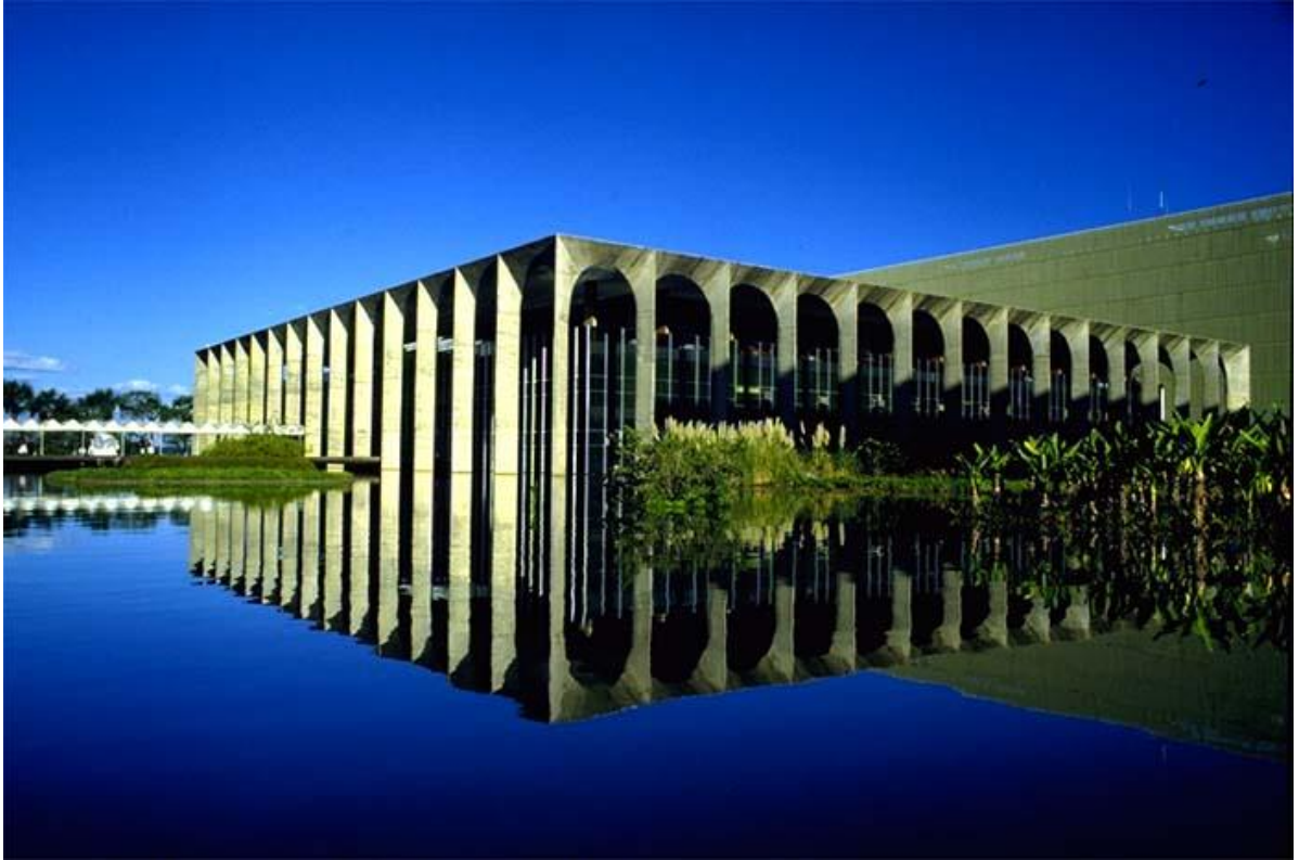
Palácio dos arcos Brasília-DF 1965