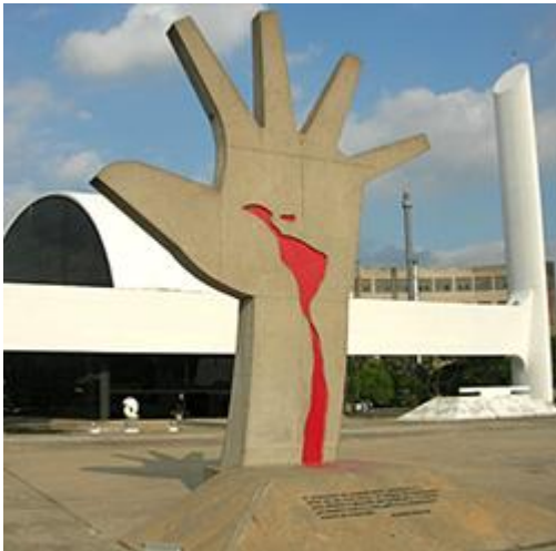
Memorial da América latina São Paulo-SP 1987