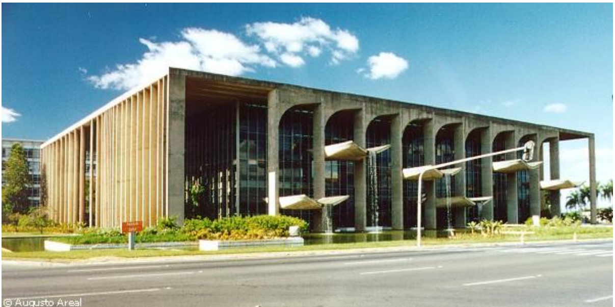
Ministério da justiça Brasília-DF 1961