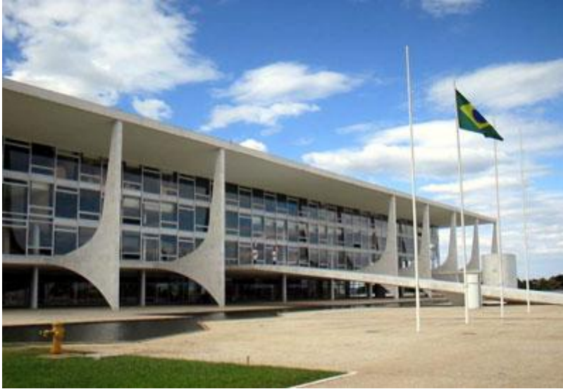
Palácio do planalto Brasília-DF 1958