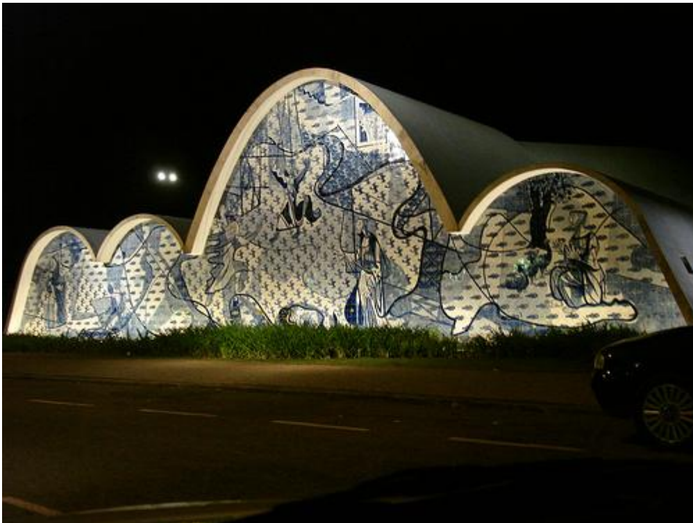
Igreja da Pampulha Belo Horizonte - MG 1939